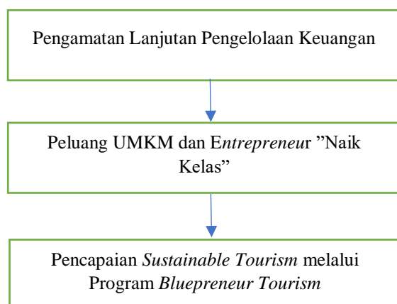
Gambar 2. Kerangka Berpikir