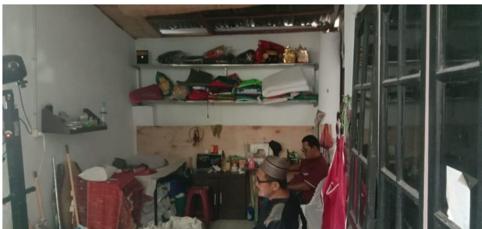
Gambar 4. Dokumentasi kegiatan

Sekar Handycraft dipilih sebagai lokasi Pengabdian Kepada Masyarakat dengan jenis produk berupa souvenir pernikahan, tas, dompet, kerajinan ulos dan lain-lain. Dari hasil pengamatan awal, telah diperoleh data bahwa walaupun mampu bertahan, pandemi Covid-19 telah mengakibatkan UMKM Sekar Handycraft mengalami penurunan penjualan produk dan sempat mengalami kerugian. Juga diperoleh data bahwa pengelolaan keuangan walaupun telah dilakukan tidak lagi secara manual, tetapi belum sepenuhnya mempergunakan aplikasi penunjang pencatatan keuangan digital, sehingga belum sesuai Standar Akuntansi Keuangan Entitas Mikro, Kecil dan Menengah yang berlaku di Indonesia. Hal ini merupakan sesuatu yang banyak ditemukan pada pelaku UMKM di Indonesia, seperti yang juga disebutkan dalam penelitian (Yanuardi et al., 2023), (Asyik et al., 2022) dan (Novietta & Nurmadi, 2020).