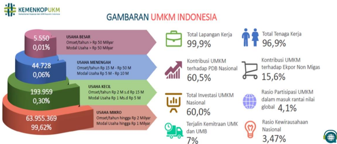
Gambar 1. Gambaran UMKM di Indonesia

Dapat dilihat pada gambar 1 di atas, menurut Kementerian Koperasi dan Usaha Kecil dan Menengah (KemenkopUKM), gambaran UMKM di Indonesia, termasuk total lapangan kerja (99,9%), total tenaga kerja (96,9%), kontribusi UMKM terhadap PDB Nasional 60,5% dan hal penting lainnya. Juga terlihat, dari keseluruhan UMKM yang terdaftar di Kementerian Koperasi dan Usaha Kecil dan menengah (KemenkopUKM), usaha mikro memiliki persentase terbesar yaitu 99,62% ( www.kemenkopukm.go.id , 2024). Hal ini tentunya menjadi perhatian khusus Pemerintah, karena besarnya omset per tahun dan modal usaha pelaku UMKM yang belum dapat menembus bidang Usaha Kecil maupun bidang Usaha Menengah. Banyak hal telah dilakukan Pemerintah agar UMKM dapat "Naik Kelas", diantaranya dengan mengeluarkan Kredit Usaha Rakyat (KUR), Pusat Layanan Usaha Terpadu (PLUT) Koperasi dan UMKM, Program Fasilitasi Sertifikasi dan Standarisasi Produk Usaha Mikro, hibah bantuan modal, dan lain-lain.