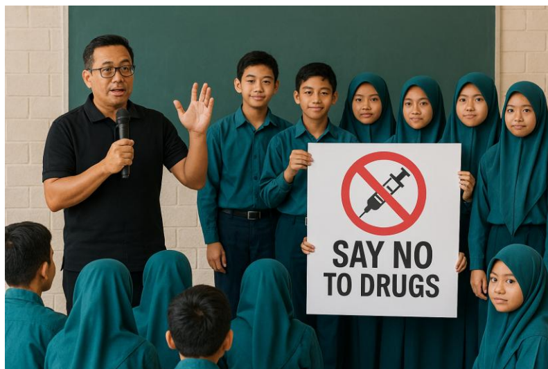
Gambar 2. Iustrasi Suasana Sosialisasi dan Antusiasme Siswa SMP Al Razi